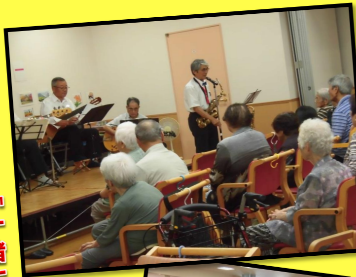
「一緒に歌いましょう♪」